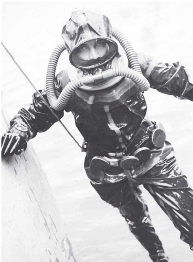
Eigenbau-CV-Anzug des Autors

Der Zuschnitt des Tauchanzugs war so reichlich, dass wir trotz unterschiedlicher Körpergröße (einzeln ;-) bequem darin Platz hatten. Über einem Zink-Waschtopf gelang es mir dann, auch den Anzug mit der Halsmanschette faltenfrei mit Gummilösung zu verkleben. Die Kapuze erhielt im unteren Bereich eine Gummi Manschette und ein Mundstück für die Atemschläuche. Zum Schluss mussten die Nähte noch mit Streifen dichtgeklebt werden. Die Manschetten von Anzug und Kapuze garantierten, über einen Metallring gezogen, eine perfekte Abdichtung des Tauchanzugs. Ich hatte mich entschlossen, die Atemschläuche nur auf das Mundstück aufzuschieben und nicht zu verschrauben oder abzubinden. Dadurch war der Taucher in der Lage, im Notfall die Schläuche abzuziehen.