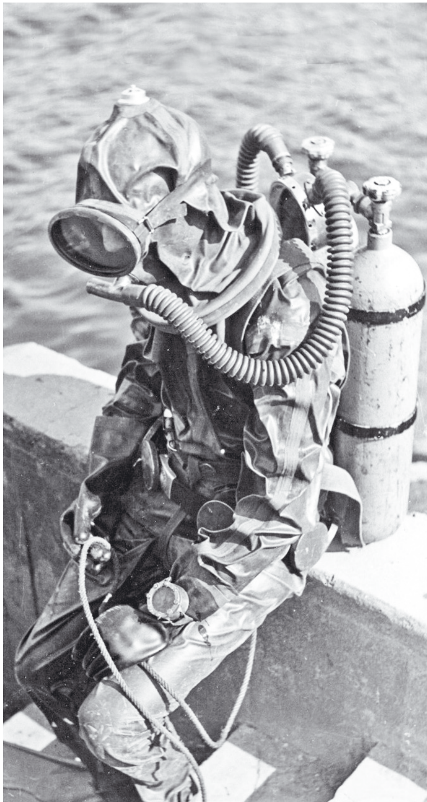
Links: Tauchen mit dem selbstgebauten Sauerstoff-Kreislaufgerät und Harpune für die Selbstversorgung